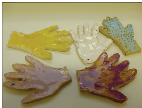
Práce dětí z Programu Lauderovy školky v Praze

Program Lauderovy školky v Praze je samozřejmě součástí života obce, nyní jsou ve školce již i děti absolventů Lauderových škol, takže se jedná o druhou generaci.