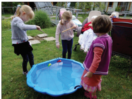
DSP Hagibor – Sportovní den