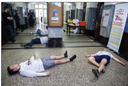
Seminář izraelské národní zdravotnické záchranné služby Magen David Adom

Bezpečnost je vzhledem k aktuálním hrozbám i nadále jedním z prioritních témat obecního života. Oddělení bezpečnosti ŽOP (OB) proto kontinuálně pracovalo na zvyšování odolnosti chráněných objektů a zajišťovalo průběžné opravy, revize i nové projekty technických prvků fyzické bezpečnosti. Vedle koncepční a plánovací činnosti spolupracovalo OB se všemi středisky a odděleními ŽOP, s mnoha dalšími židovskými spolky a organizacemi i se státními a komunálními institucemi, do jejichž gesce bezpečnost patří.