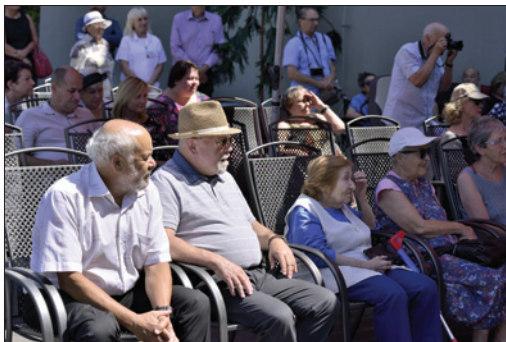
DSP Hagibor – Oslavy 10. výročí otevření DSP Hagibor

V rámci CDA se v roce 2018 konaly také mimořádné debaty s nejvyššími představiteli Židovské obce v Praze, což mělo pozitivní ohlas jak mezi klienty, tak mezi pracovníky.