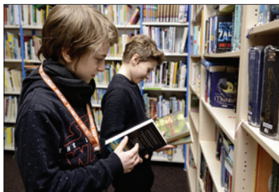
Lauderovy školy – školní knihovna

Také v roce 2018 dotovala ŽOP významným způsobem činnost Lauderových škol (32 % rozpočtu školy). Lauderovy školy představují jedinečný vzdělávací projekt určený dětem, žákům a studentům se zájmem o výchovu v duchu židovství. Základní škola vznikla v roce 1997, od roku 1999 existuje gymnázium a od roku 2009 mateřská škola. V září 2016 byl obnoven druhý stupeň ZŠ. Výuka na všech vzdělávacích stupních probíhá podle vlastního školního vzdělávacího programu