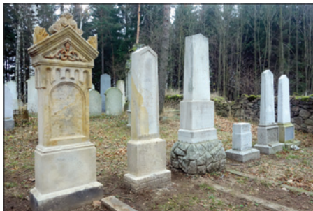
Židovský hřbitov v Dřevíkově

Původně plánovaný rozpočet SBH pro rok 2018 nebyl překročen a ve výsledku došlo dokonce k úspoře ve výši 60 000 Kč .