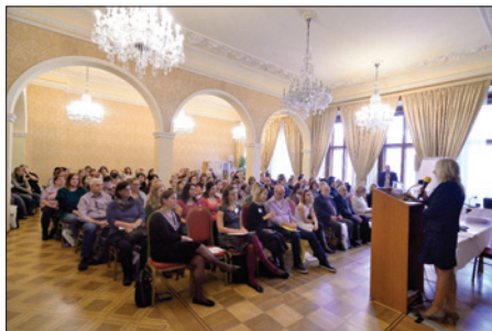
KDP Ezra zorganizovala konferenci „Péče o seniory – Inspirujte se!“

V roce 2018 bylo v péči KDP Ezra 149 klientů. Těmto klientům bylo celkem poskytnuto kolem 13 090 hodin péče – sociální, zdravotní a ergoterapeutické.