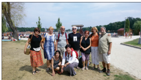
Klub zdraví – výlet ke Kamencovému jezeru

Dobrovolnický program pro zahraniční i místní dobrovolníky. Program je akreditován u Ministerstva vnitra a mezi jeho hlavní aktivity patří především dobrovolnická kavárna Miriam, návštěvy dobrovolníků v domácnostech klientů, v Penzionu Charlese Jordana a v DSP Hagibor, pomoc na Starém židovském hřbitově na Žižkově. Za rok odpracovalo 42 dobrovolníků ze skupiny Tmicha 2727,5 hodin. V průběhu roku 2018 působili v oddělení čtyři zahraniční dobrovolníci – dva z Německa a dva z Rakouska. Tito mladí dobrovolníci