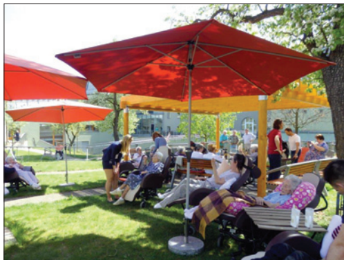
DSP Hagibor – Vítání jara

V provozu byly webové stránky DSPH www.dsphagibor.cz .