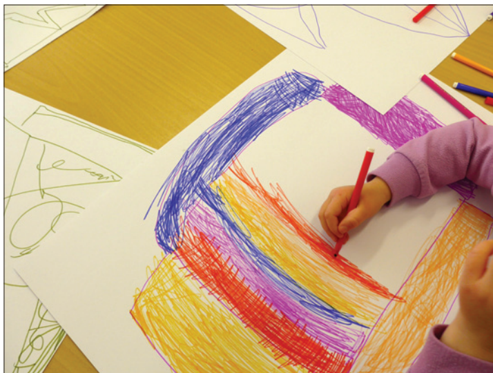
Práce dětí z Programu Lauderovy školky v Praze

ŽOP zlepšuje komunikaci se svými členy – od ledna 2018 jsou členové prostřednictvím e-mailu informováni elektronickou formou – dostávají každý týden newsletter: Kulturní, společenské a náboženské akce.