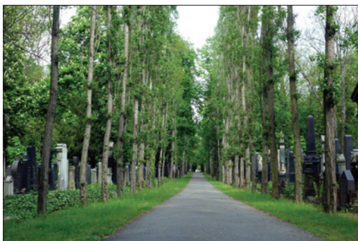
Nový židovský hřbitov v Praze 3

V srpnu 2010 došlo k rozdělení správy NŽH na dvě části, část rituální, podřízenou rabinátu ŽOP, a část technickou ve správě Matana, a. s. Pod nově vzniklou správou byla převedena i pracovní četa čítající čtyři pracovníky v dělnické profesi (hřbitovní dělníci, zahradníci a údržbáři). Na této technické správě během roku 2011 již plně ležela odpovědnost za správu zeleně, budov, komunikací i náhrobních kamenů a hrobek. Rituální správa byla v srpnu 2011 doplněna vedoucím,