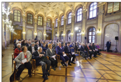
Den památky obětí holocaustu a předcházení zločinům proti lidskosti, Senát Parlamentu ČR, 26. ledna 2018