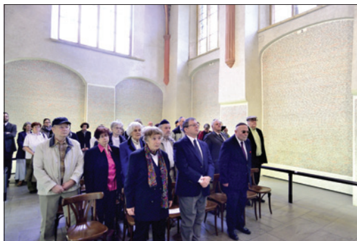
Jom ha-šoa 5778 (2018), Pinkasova synagoga, 12. dubna 2018