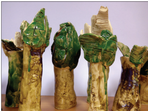
Práce dětí z Programu Lauderovy školky v Praze

Program Lauderovy školky v Praze je realizován ve Fakultní mateřské škole Na Výšinách, ve třídě se specifickým programem pro židovské děti. Ve Fakultní mateřské škole při Pedagogické fakultě UK je jedna z tříd určena dětem z židovských rodin, na kterou připívá Židovská obec v Praze. Tento program, zřízený radou městské části Praha 7, je realizován 24 let a je určen dětem předškolního věku přináležejícím k ŽOP.