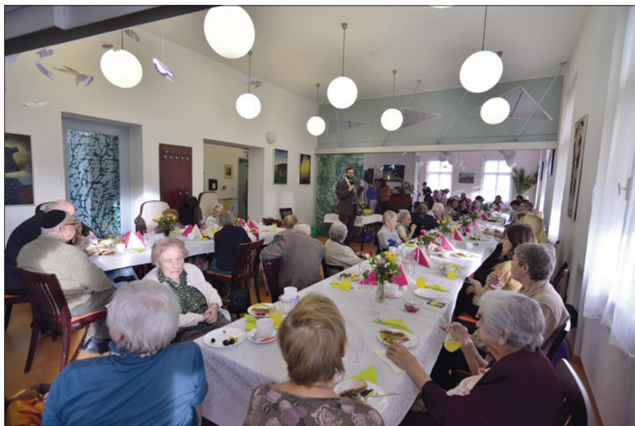
Tu bi-švat na Hagiboru 31. ledna 2018