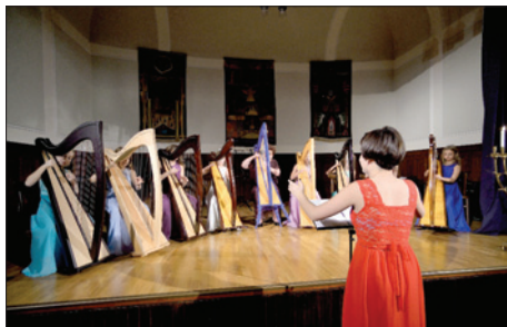
Chanuka na Židovské obci – vystoupení osmi harfenistek