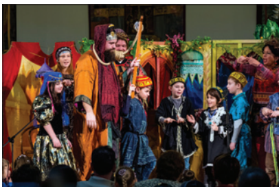
Purimová oslava na Židovské obci