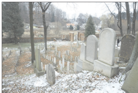
Židovský hřbitov v Polné