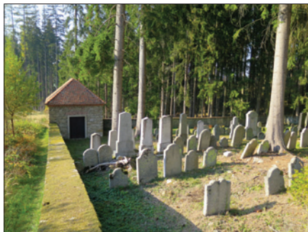
Židovský hřbitov v Markvarci

Mezi nejvýznamnější stavební akce roku 2018 u komerčních objektů patří oprava světlíku hlavní lodi Jeruzalémské synagogy za 1 698 000 Kč , oprava střechy domu v Berouně za 1 666 000 Kč a oprava střechy v Dlouhé 37 ( 464 000 Kč ). Pokračuje projektová příprava rekonstrukce a dostavby domu v Dlouhé 37, celkové náklady na projektovou přípravu dosáhly v roce 2018 částky 0,67 mil. Kč . V rámci chystané rekonstrukce Lauderových škol byly provedeny přípravné