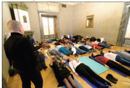
Z konference „Péče o seniory – Inspirujte se!“

V uplynulém roce KDP Ezra zrealizovala konferenci Péče o seniory – Inspirujte se! pod záštitou MPSV. Na konferenci vystoupili čeští a zahraniční odborníci a byla určena pro profesionály v sociálních službách. Hlavními tématy byly odvaha měnit zažitá postupy, ochota inspirovat ostatní, motivace pomocí příběhů a praktické a věcné workshopy. Dále byl naplněn cíl rozšířit informovanost o vysoké úrovni sociálních služeb v ŽOP.