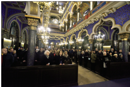
Svátky světel v Jeruzalémské synagoze