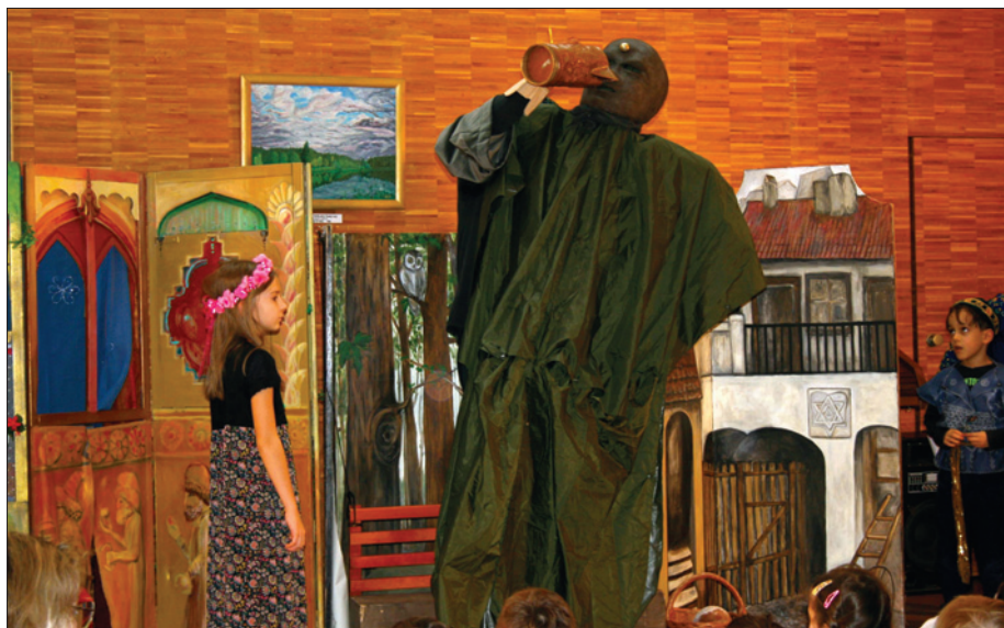
Dětský Purim 4. března na Hagiboru