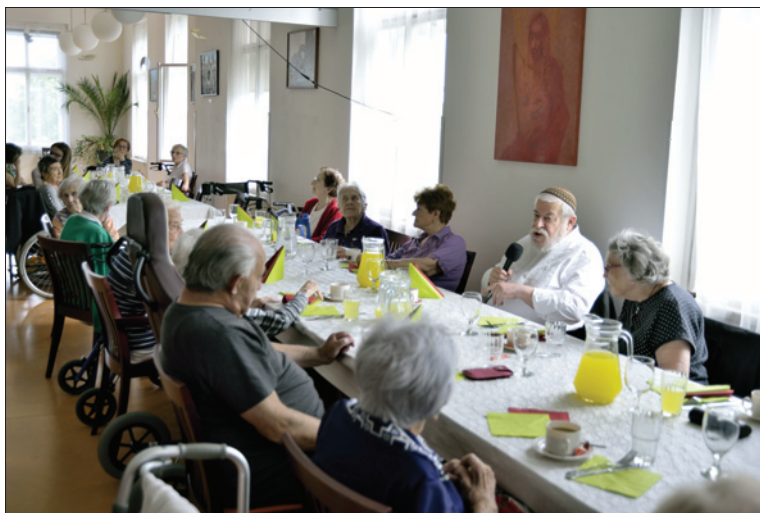
Lag beomer na Hagiboru, 2. května 2019