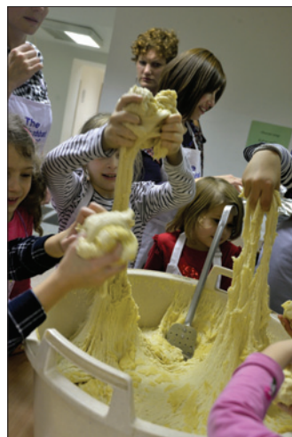
Pečení chaly – Lauderovy školy, 25. 10. 2018

Nový židovský hřbitov (NŽH) patří mezi památkově chráněné objekty. Jelikož se jedná o hřbitov, který je kontinuálně využíván ke konání pohřbů zesnulých židovského vyznání od roku 1890, vyžaduje jeho stav stále nákladnější péči. Provoz tohoto hřbitova a urnového háje se řídí řádem neveřejného pohřebiště platným od 1. ledna 2002 a náboženskými zvyklostmi židovské obce.