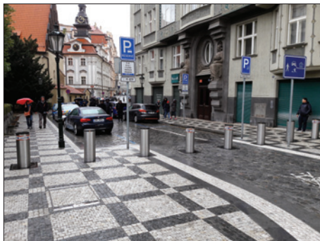
Nové bezpečnostní sloupky v oblasti Maiselovy ulice

V roce 2018 získala ŽOP koncesi pro výkon živnosti „ochrana osob a majetku“ a oddělení bezpečnosti prošlo zásadní reorganizací, jejímž cílem bylo zajistit konkurenceschopné podmínky pro nábor nových zaměstnanců.