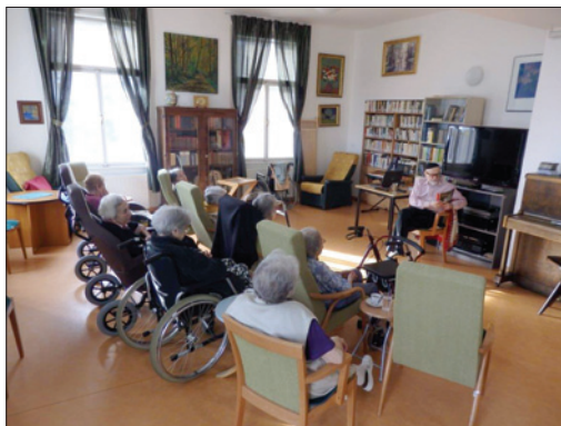
DSP Hagibor – Hudební program v CDA

Pobytová služba Odlehčovací služby poskytuje nezbytný odpočinek rodinám nebo osobám pečujícím o svého člena – blízkou osobu v domácnosti. Klienty této služby mohou být jak senioři, kteří z důvodů snížené soběstačnosti a zhoršeného zdravotního stavu potřebují celodenní péči druhé